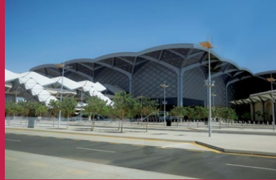
صورة واقعية لمحطة قطار الحرمين