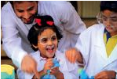
عطلات نهاية الأسبوع