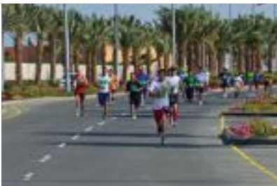
الماراثون السنوي لمدينة الملك عبد الله الاقتصادية