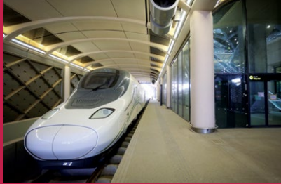
صورة واقعية للقطار

نبي مدينة المستقبل بمواصفات فريدة تكتمل معالمها مع تنامي الحركة السكانية. الأحياء الساحلية، هي الجزء الحيوي في هذه القصة.