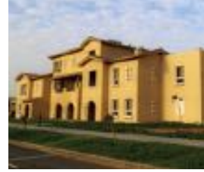
فلل التاون هاوس