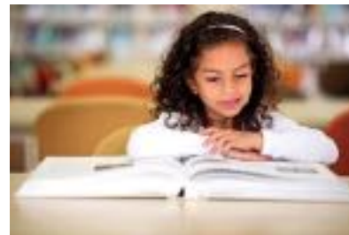
مهرجان الكتاب للأطفال