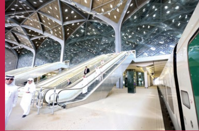
محطة قطار الحرمين