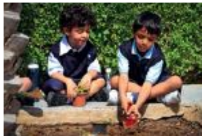
غرس الأشجار احتفالاً باليوم العالمي للأرض